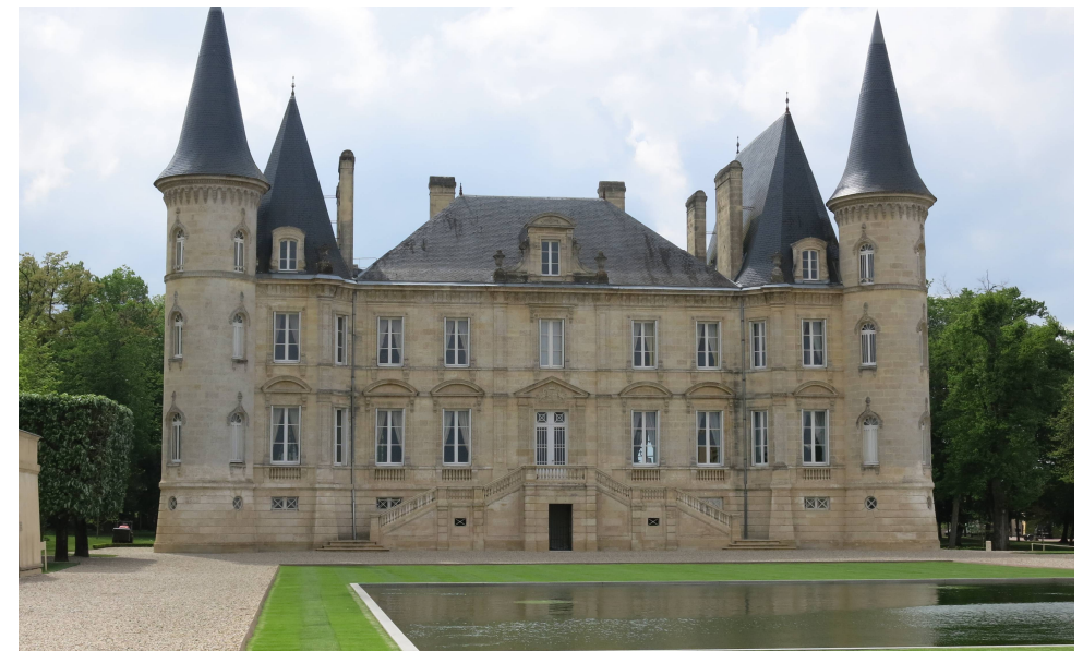
Château Pichon Longueville-Baron

* mit der Einladung schriftlich abgegeben.